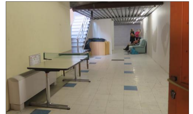
À l'étage, l'abri pour les familles, en box séparés. Actuellement, il y a 20 personnes hébergées (5 familles).