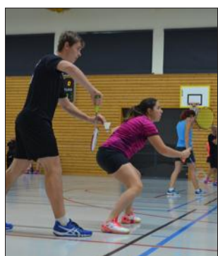
Le double mixte, toujours très apprécié des badistes.