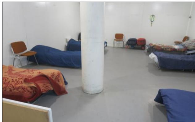
Au rez-de-chaussée pour les personnes isolées : un dortoir femmes (5 places) et deux dortoirs hommes (15 places) et 5 places supplémentaires en cas de froid extrême.

Les travaux sur le bâtiment débuteront début 2019. La semaine dernière, les architectes ont été consultés. Cette