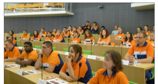
Une centaine de bénévoles de la Protection civile 74, venus de tout le département, a assisté vendredi à l'assemblée générale statutaire tenue dans le grand amphithéâtre d'Annemasse Agglo.

Pour autant, les activités promotionnelles liées à la communication n'ont pas été oubliées, à l'instar du stand installé dans l'enceinte de la Foire de La Roche-sur-Foron, l'action de sécurité routière au lycée des Glières ou la