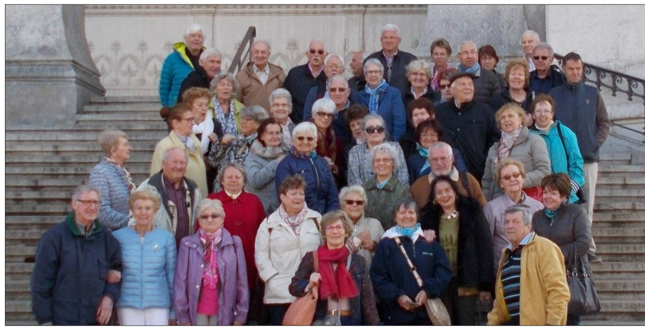
G.T. Sur les marches de la basilique Notre-Dame de Fourvière.

Profitant d'un temps exceptionnel, l'amicale des Suisses d'Annemasse a pris jeudi le chemin de Lyon pour une journée de découvertes. Le matin était consacré à la basilique Notre-Dame de Fourvière. Le décor intérieur est très riche, en particulier les mosaïques et les vitraux. La bise soufflant fortement sur la colline n'a pas empêché le groupe d'admirer la vue sur la ville de Lyon. Le funiculaire surnommé «la ficelle» les a ensuite descendus au cœur du Vieux-Lyon. Après un bon repas dans un fameux «bouchon lyonnais», les 51 membres du groupe ont suivi une visite guidée de la Maison des Canuts pour se rendre compte de l'énorme travail que représente le tissage de la soie et les exigences de ce métier.