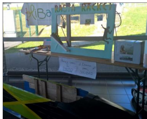
Tout au long du tournoi, on a pu se faire prendre en photo dans un cadre ou un bobsleigh rasta au profit de l'association Solibad.