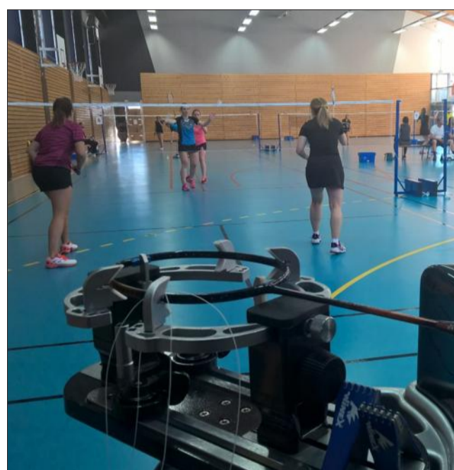
Pour la première fois, le tournoi «Rasta Racket» s'est déroulé sur deux gymnases (Balmat et Salève), pour permettre aux badistes de s'inscrire sur plusieurs tableaux.