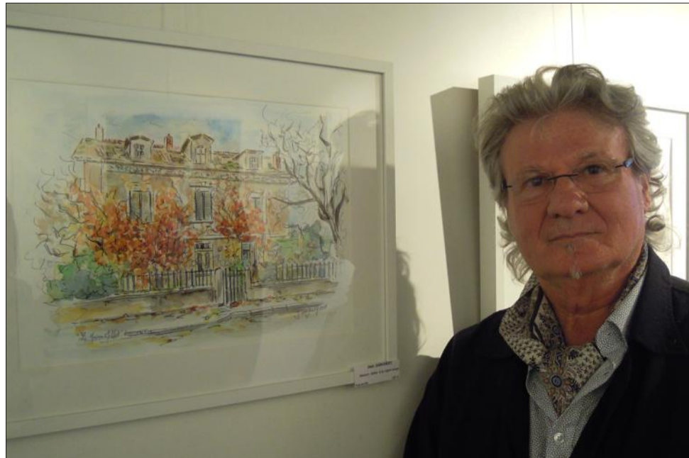
Jean Garchery sublime les belles demeures de l'agglomération.

www.pronoiart.com ; tél. 07 81 36 03 86.