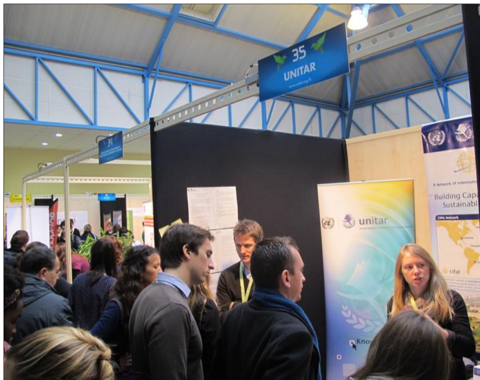
Depuis sa création en 2008, le Salon des métiers de l'humanitaire accueille de très nombreux visiteurs, environ 3000 lors des dernières éditions.

Le Salon proprement dit se déroule comme d'habitude le samedi à Martin-Luther-