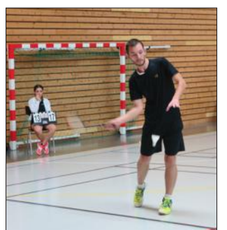
Hier, place aux simples. Une belle compétition pour les locaux mais aussi pour les participants venus de toute la France.

Hier, vendredi, place aux tableaux de simple (de 8h à 21h). Aujourd'hui samedi, le B2A enchaîne avec les tableaux de doubles hommes et dames (de 8h à 20h). Dimanche se joueront tous les tableaux de