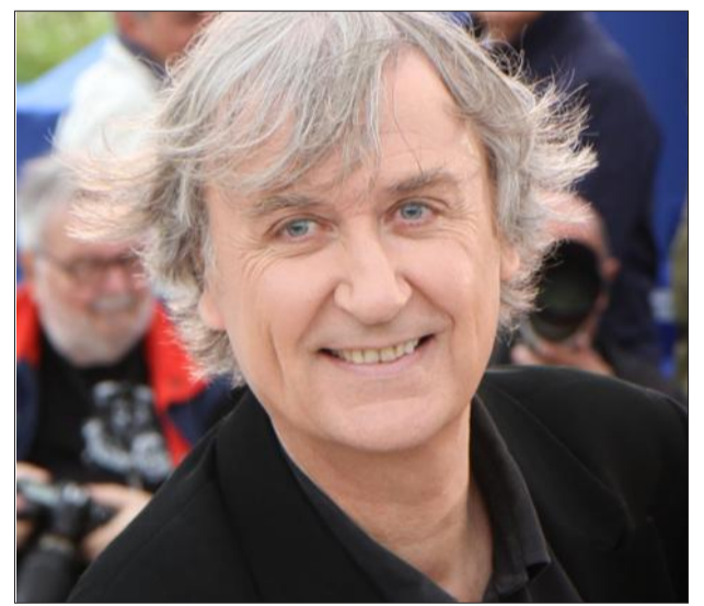
Plantu, l'un des plus célèbres dessinateurs de presse français, assistera au salon et donnera une conférence.

Plantu donnera une conférence ouverte à tous, samedi 26 novembre à 17 heures au complexe Martin-Luther-King. Entrée gratuite.